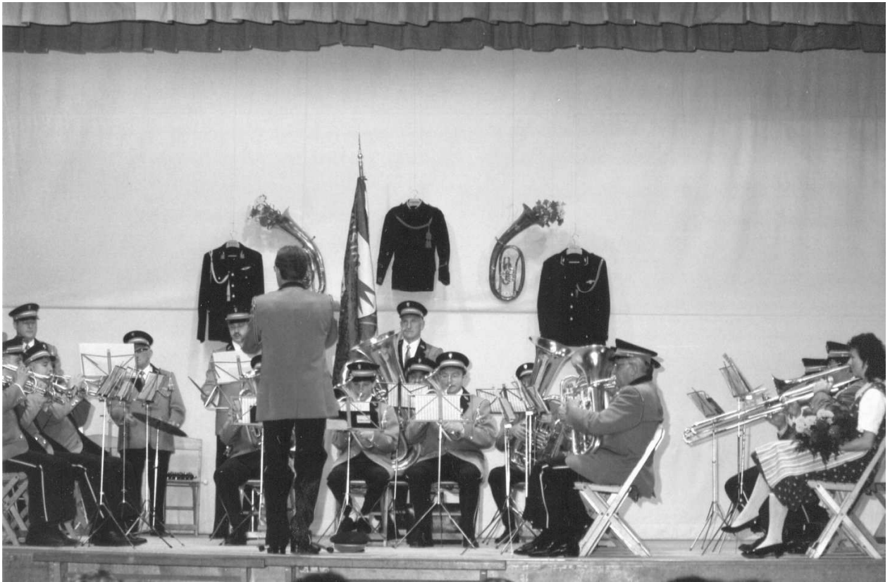
24./25.März: Einweihung der neuen Uniformen