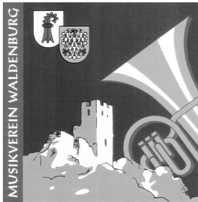
Unsere neue Fahne 1999