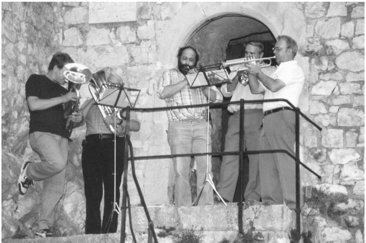
Erstes Freikonzert 1986 auf dem Schloss

Am 18./19.Oktober: Vereinsreise nach Waldenburg Hohenlohe (BRD).