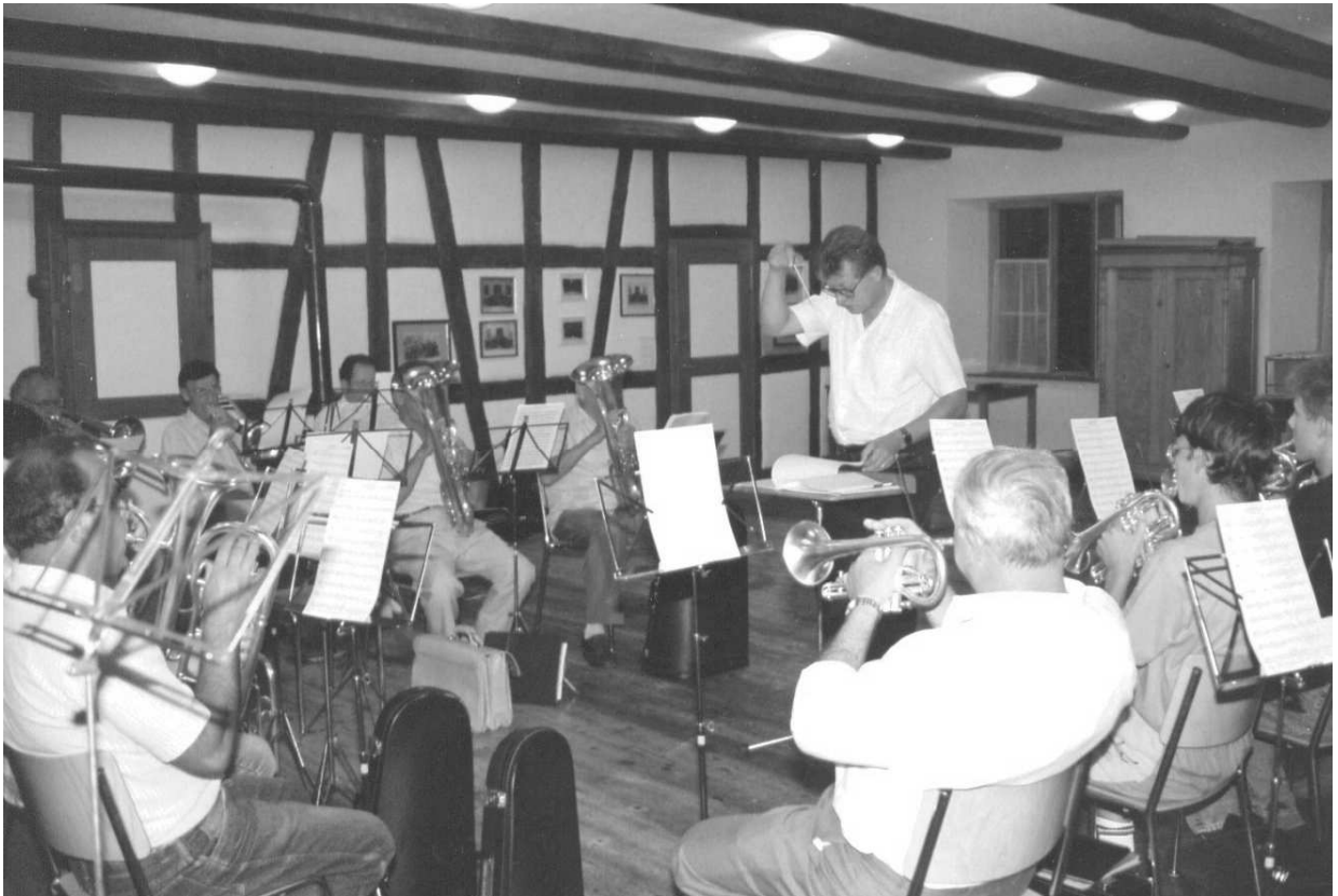
Erste Musikprobe im neuen Lokal Kirche

Am 12. November konnte das neue Probelokal eingeweiht werden und am 19. November fand dort die erste Musikprobe statt.