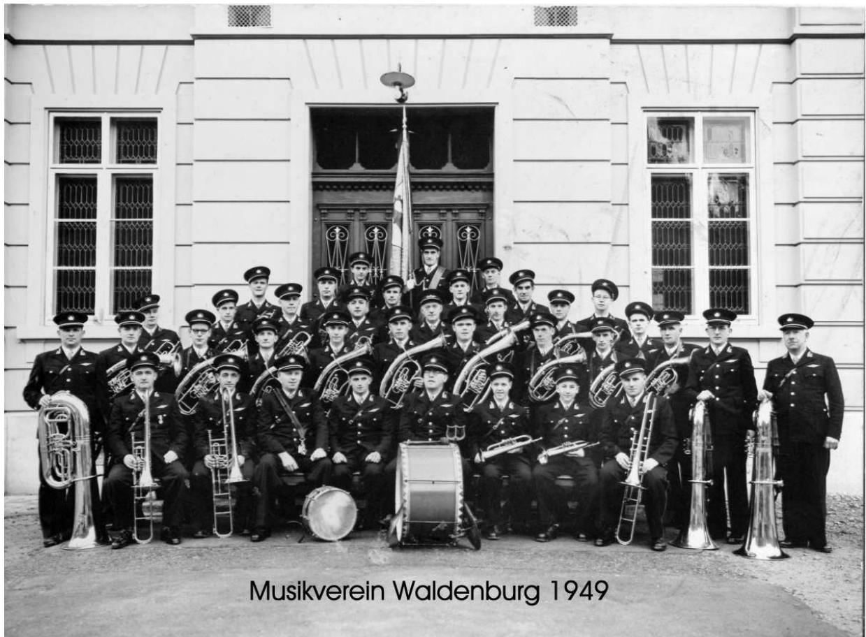
Musikverein Waldenburg 1949

Am 13.März: Konzert im Radio-Studio Basel: anschliessend kleines Ständchen in Liestal nach "kleinem Imbiss".