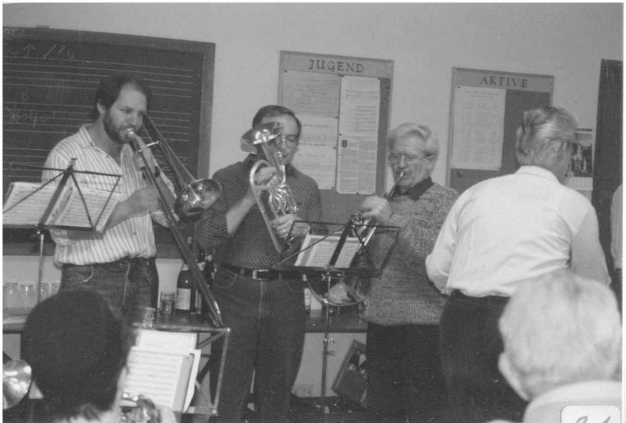
Okt.1990, wir besuchen den MV Maulburg

Am 18.September: Besichtigung von 3 Räumen in der Kirche für neues Musiklokal.