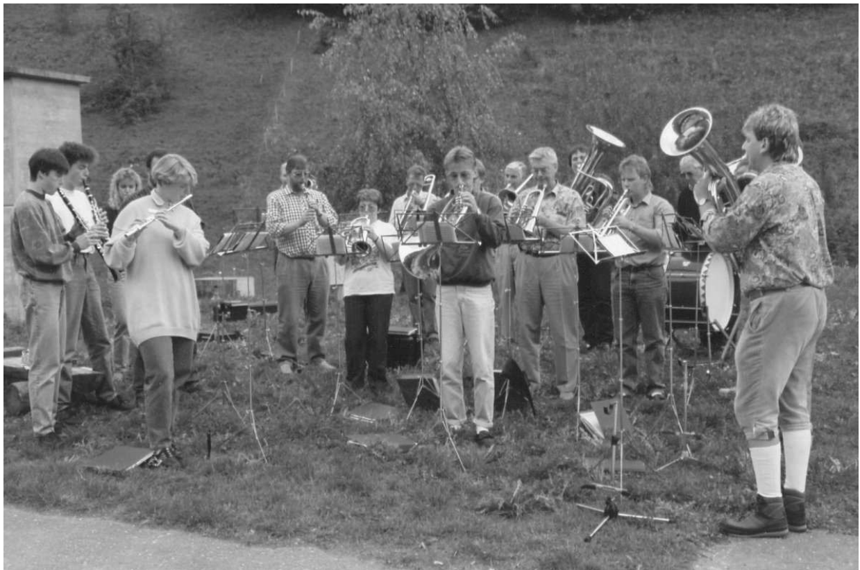
Besuch vom MV Maulburg 1992

Am 20.September wurde mit dem Musikverein Maulburg ein Herbstaumarsch über das Schloss mit einer Städtlitour durchgeführt.